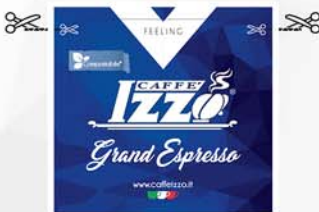
Doppio invito al taglio Double tear notch